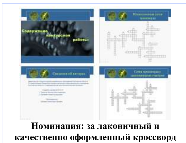
Номинация: за лаконичный и качественно оформленный кроссворд