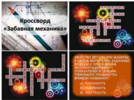
Номинация: за эффективное применение ИКТ