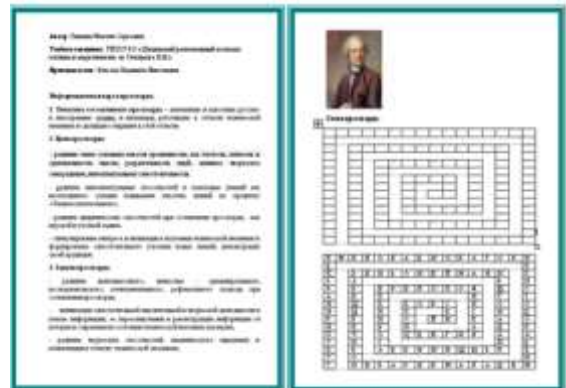
Номинация: за познавательную ценность