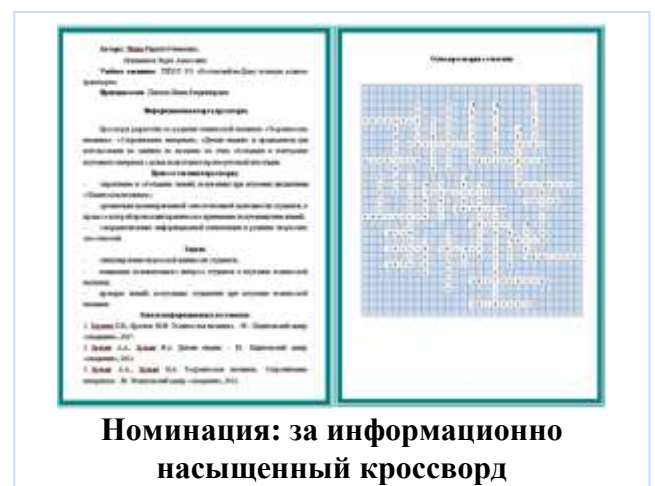
Номинация: за информационно насыщенный кроссворд