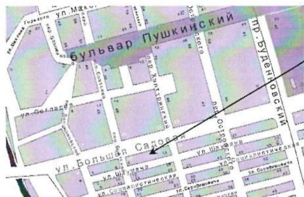
Схема расположения ГБПОУ РО «РАДК»

Наш адрес: 344082 г. Ростов-на-Дону, ул. Большая Садовая, 26-28/9А ГБПОУ РО «РАДК»